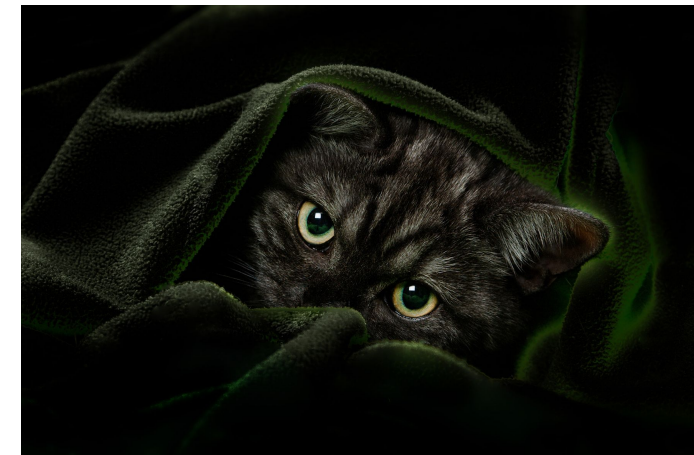
„cat eyes“ Medaille Landesfotomeisterschaft 2011