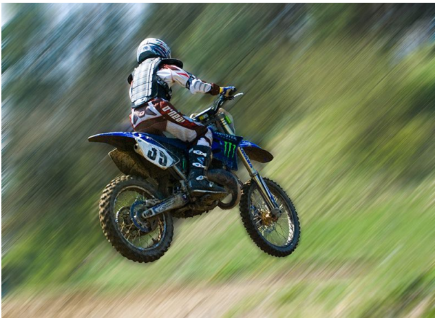
„Hochsprung“ Annahme Landesfotomeisterschaft 2011

Themenwettbewerb „Sport“ und Bildbesprechung zum Thema „frei“ (3 digitale Bilder pro Gast / Mitglied)